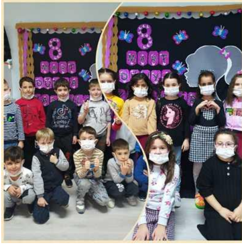
Sevgi nedir diye sorduk ve resimlemelerini istedik.