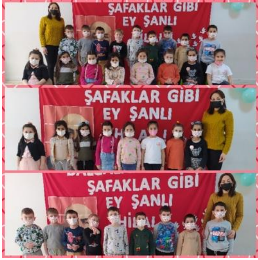
İstiklal Marşımızın Kabulü.