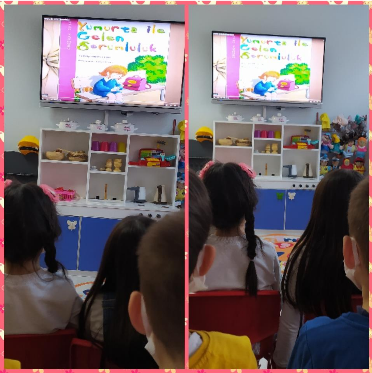
Yumurta ile gelen sorumluluk hikayemizi dinledik.