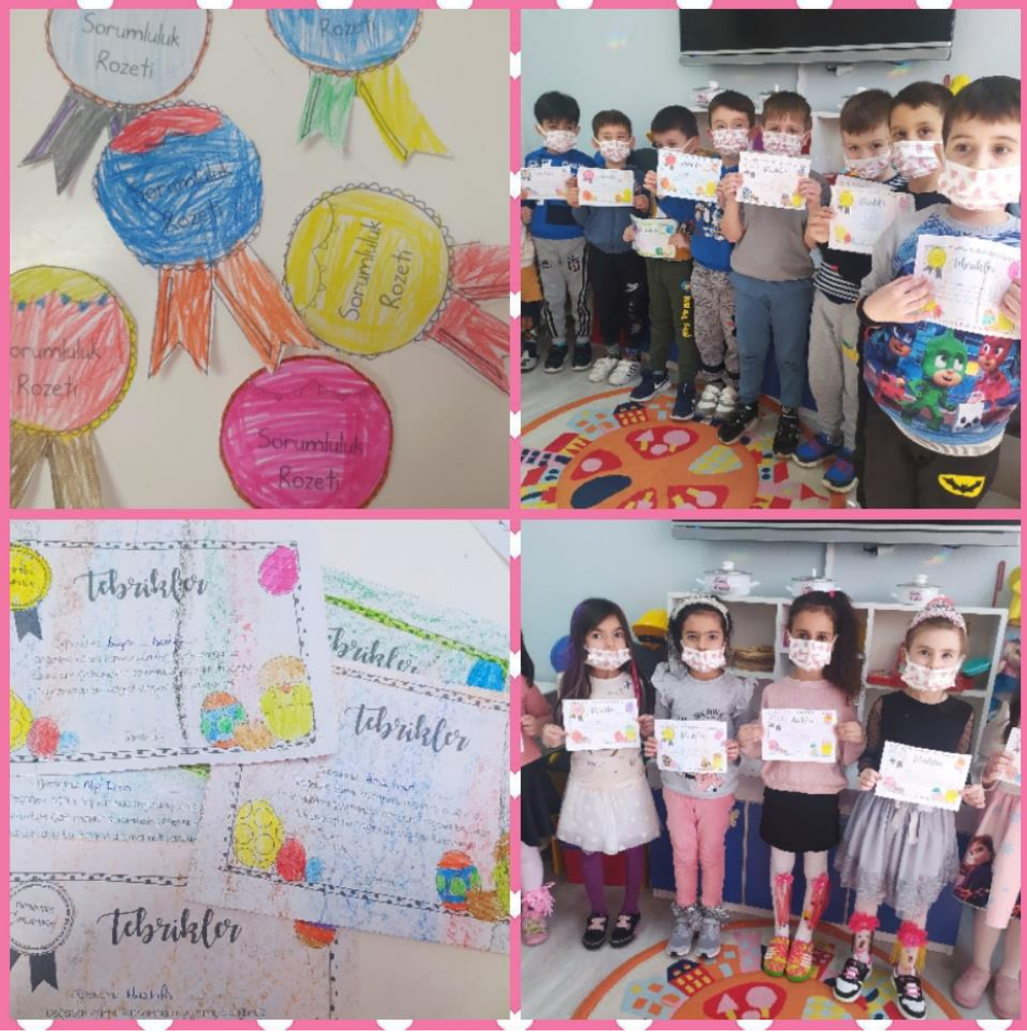
Etkinlik bitiminde aldığı sorumluluğu yerine getiren öğrencilerim tebrik kartlarıyla ödüllendirildi.